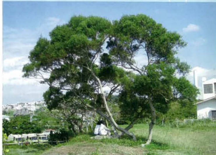
古都和海の見える丘