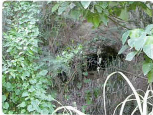
壕入口（半分崩れています。）

通称ナゲーラ壕と言われているが、地元ではシチャーラの壕と呼ばれている。沖縄戦の第一線で米軍と戦火を交えた日本陸軍第62師団（石部隊）の野戦病院壕跡。首里高等女学校生と昭和高等女学校生が日本軍に動員されましたが、今では訪れる人も少ない重要戦跡の一つです。