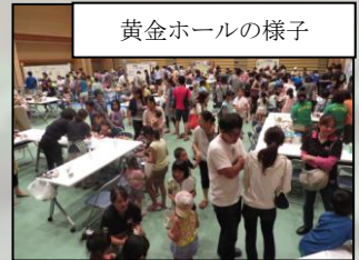
黄金ホールの様子

昨年に引き続き、黄金ホールを使った豊富な体験メニューに加えて、今年は初の試みとして消防、警察、フロントなど、「お仕事体験」を実施。憧れのお仕事を体験した子どもたちは目を輝かせていました。