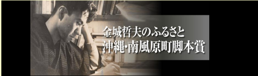
金城哲夫のふるさと 沖縄・南風原町脚本賞