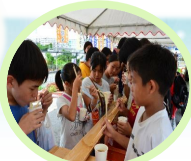
↑ 流しそうめんの様子 みんな美味しそうに食べていました♪