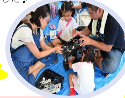
← 機械分解の様子 色々な機械を分解したよ♪

シマぞうりやバルーンアート、シーサー、アロマ、パステルアートなど色々なモノを作りました♪