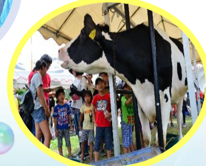
↑ 酪農体験もしました♪