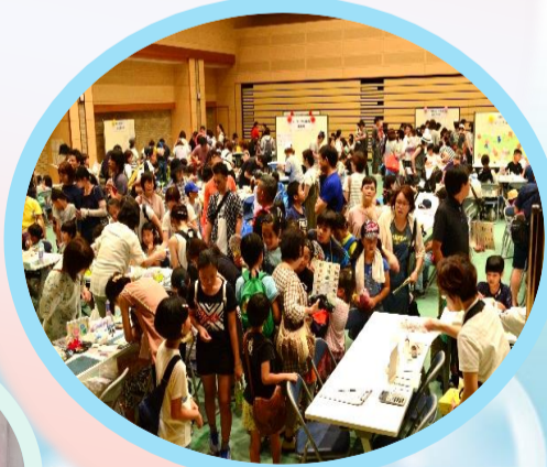
← ボランティアの皆さん ありがとうございました！