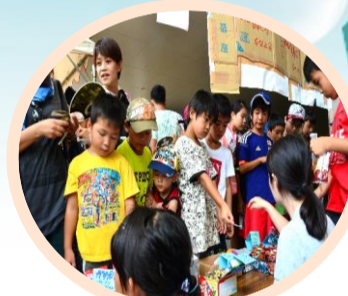
↑ 「むかしあそび」ブース 懐かしい遊びがたくさん♪