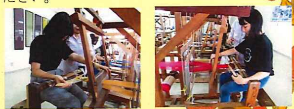
(写真: かすり会館でコースター作りを体験した高校生)

10月に入り、民泊の後半シーズンがはじまりました。10月第1週に兵庫県から2校、新潟県から1校の修学旅行民泊を受入れました。台風後の慌ただしいタイミングでしたが、受入民家の皆さまとの暖かな交流に生徒たちも充実した時間を過ごしたようです。観光協会では民泊の受入家庭を募集しています。私たちが行っている民泊は一般の観光客を受け入れる民泊と違い、修学旅行生の受け入れを対象としています。民泊というよりも、ホームステイという感じです。県外から修学旅行で沖縄を訪れる中高生をホームステイという形で受入れて、沖縄の日常生活や文化活動を体験してもらう、という活動をしています。興味のある方、もう少し詳しく知りたいという方、お気軽に観光協会までお問い合わせください。