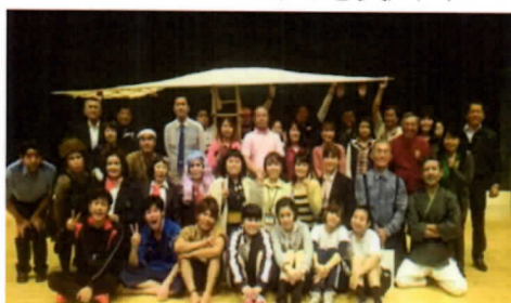
旗揚げ公演『飛べ! 若人夢をつかめ!』