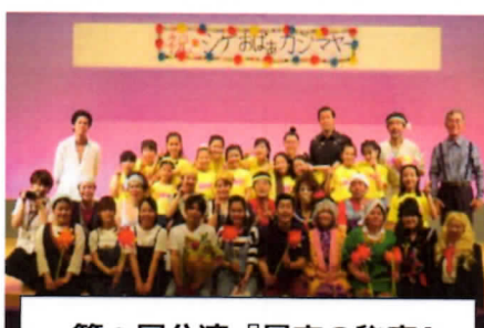
第2回公演『星空の秘密』