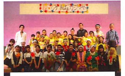
第2回公演『星空の秘密』