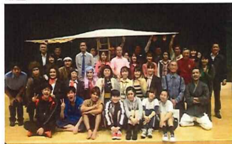
旗揚げ公演『飛べ! 若人夢をつかめ!』