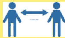
ソーシャルディスタンス