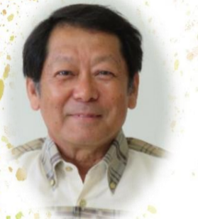
南風原町観光協会広報誌「ありんくりん」第100号発刊に寄せて