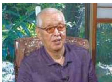
上原正三 (うえはらしょうぞう)

南風原町では、金城哲夫の足跡を記録に残そうと、共に活動・生活をした方々から、出来事や金城に対しての思いなどのインタビュー取材を行なっています。その貴重な映像の中から、数々の特撮番組・アニメ・ドラマで脚本を担当した上原正三 (1937-2020) のアーカイブ映像“短縮版”をご紹介します。